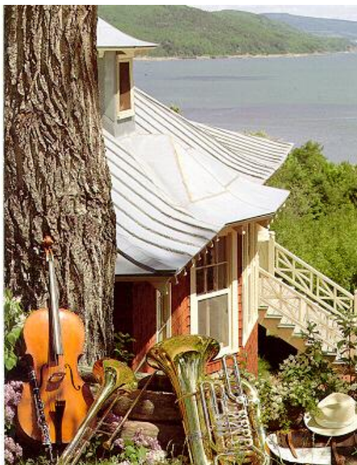
La musique en harmonie avec la nature

Comme la nourriture est excellente et abondante au Domaine Forget, les friandises ne seront pas permises dans les dortoirs.